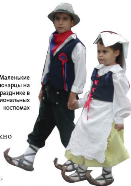
Маленькие чочарцы на празднике в национальных костюмах

Можно съездить в замок Фумоне, а можно отправиться в висячие сады, а к ужину вернуться в средневековую часть Фьюджи, чтобы попробовать вкуснейший «Коктейль из морепродуктов» в семейном рыбном ресторанчике «Иль Газеббо»: огромное блюдо с кальмарами, морскими раками, каракатицами. Хороша также здесь «Тонателли аль астиче» — свежеприготовленная мелкая лапша с омаром. Вообще, ресторанов на курорте много, и готовят тут вкусно. Обязательно попробуйте «Фетучини фунги порчини» (домашнюю лапшу с белыми грибами) или домашние колбаски из кабана с трюфелями. А те, кто не поленился отъехать от Фьюджи на 20 км в городок Акуто, смогут оценить уникальные блюда ресторана Collini ciocciari, обладателя двух звезд Мишлен. ☞