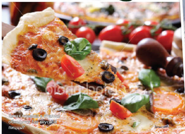
Какая поездка в Италию обходится без вкусной пиццы?

Чтобы продлить эффект лечения, воспользуйтесь новой услугой, предлагаемой на курорте: врач-термолог предпишет питьевой курс, который можно будет проходить и в Москве.