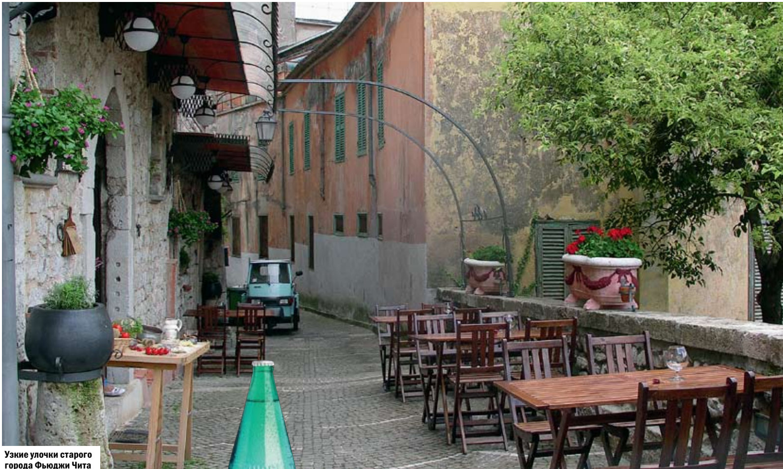
Узкие улочки старого города Фьюджи Чита

оказаться совсем не лишним. И во-все не обязательно раскрывать перед спутницей карты, рассказывая, что именно стало причиной столь неожиданной бодрости в нижнем ярусе. Упирай на то, что это обычная реакция здорового мужчины... на эту красоту, которой в мире не сыщешь равную никогда... Ну а дальше – дело техники. 3. Фьюджи – город с очень специфической романтикой. По своему настроению он чем-то похож на осеннюю Ялту из фильма «Асса»: пустынные улочки, на главной площади ни души, и, кажется, если с нее уйдете и вы, неведомая сила выключит центральный фонтан, чтобы не поливал почем зря. В термальных парках суровые старички вальсируют со старушками в буклях. Все это исподволь настраивает на этакую благодать. Сам того не замечая, ты берешь подругу за руку. И вы ходите так молча, с глупыми улыбками. Целуетесь под каким-нибудь огромным каштаном... Ну а дальше – дело техники.