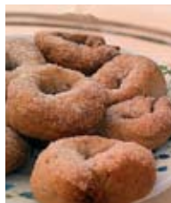
Печенье чям-белли принято слегка размачивать в красном вине, перед тем как съесть

прочих ресторанов, таверн, баров, кафе и пиццерий (а происходит это около полуночи) большинство барменов и официантов приходят именно сюда выпить по бокалу вина или кружке пива. И то и другое здесь стоит одинаково – 2 евро.