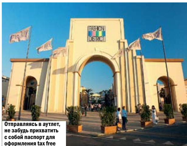
Отправляясь в аутлет, не забудь прихватить с собой паспорт для оформления tax free

И не надо морщить нос. Речь не о том шопинге, когда ты тратишь день на поиски чего-нибудь приличного, а возвращаешься домой с парой трусов, но без половины зарплаты. На те деньги, которые дерут в Москве за добротный ита-