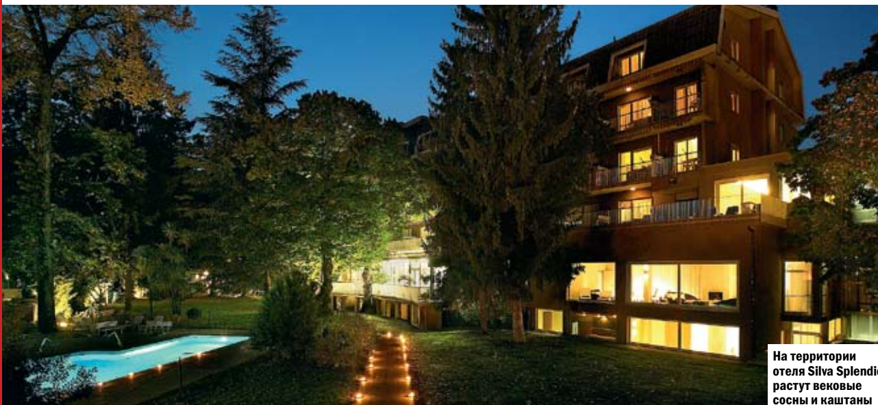
На территории отеля Silva Splendid растут вековые сосны и каштаны

Если ты никуда не спешишь, могу рассказать об обеих достопримечательностях. Тем более что до конца статьи осталась как раз пара абзацев. Начнем с колодца. Если верить местному экскурсоводу, в Средние века замок принадлежал некоему барону (вполне допускаю, что у него даже было какое-то имя, но в контексте историй про девственниц и мальчика оно не упоминалось, так что извини). Причем, что характерно, принадлежал ему не только замок, но и право первой ночи, распространявшееся на жителей Фумоне и его окрестностей. И в этом своем праве барон был, гад, исключительно требователен. Девушка должна была не просто отдаться ему за день до вступления в брак, но сделать