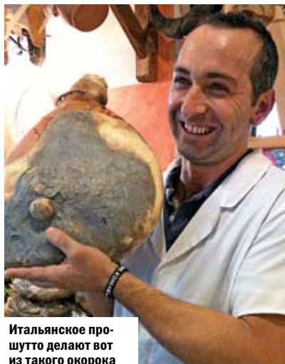
Итальянское про-шутто делают вот из такого окорока

домой неотдохнувшим. Так уж устроила природа, что понятия «релакс» и «базар», увы, несовместимы, а Рим как есть один большой базар. Целый день ты, орудуя локтями, продираешься сквозь толпу японцев с фотоаппаратами, отбиваешься от торговцев сувенирами, которые на манер родных ментов сидят под каждым кустом, стоишь в километровых очередях, чтобы обозреть очередные развалины, с видом эстета (ну чтоб не так обидно) пьешь кофе за 400 рублей у фонтана Треви, а затем возвращаешься в отель и платишь 200 евро просто за то, чтобы поспать.