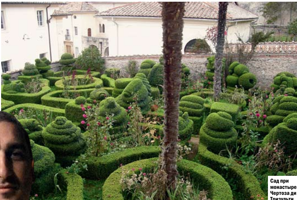
Сад при монастыре Чертоза ди Тризулти

1. Сам по себе городок довольно маленький. Его весь вдоль и поперек можно обойти за день. Максимум за два. А это значит, что очень скоро на