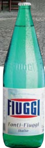
Лечебная вода «Фьюджи» повышает потенцию

Бронируя тур в Италию, человек недалновидный захочет поселиться в центре туристического Рима. Чтобы завтракать с видом на Колизей, а после пешком гулять до Ватикана. Ну да, ну да... Тебе, человеку прагматичному, должно быть очевидно: это бред. Турист, проведший отпуск в Риме, возвращается