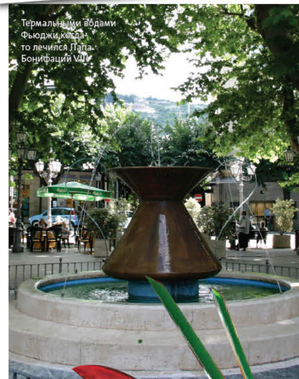
Термальными водами Фьюджи когда-то лечился Папа Бонифаций VIII